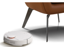
Легкий уход и удобство