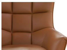
Дизайн и функциональность